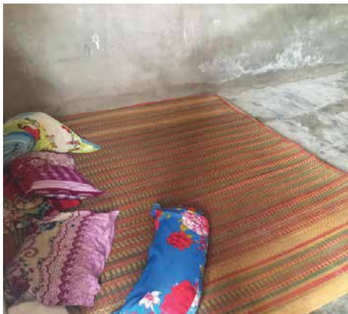
Chỗ ngủ phía trước của gia đình. Nơi đây bị ngập nước mỗi khi thủy triều cao hay mưa lớn