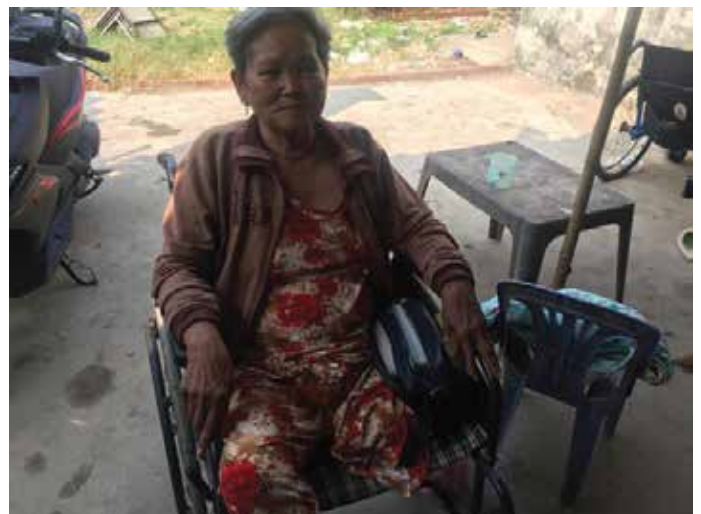
Mỗi ngày thiêm Ba đi bán vé số nuôi gia đình

Cuối năm của tết nguyên đán Hội thánh đến thăm và chúc tết chính quyền huyện Đông Hải thì có ghé thăm chú thiêm, nhà